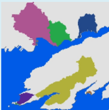
Champ / Légende BVERS