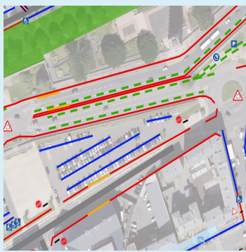
Champ / Légende SYMBOLOGIE