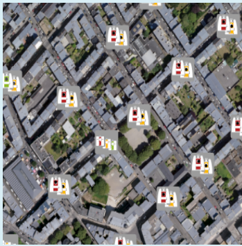
Champ / Légende CD_NATURE