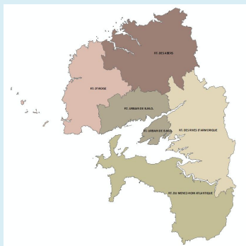
Champ / Legende