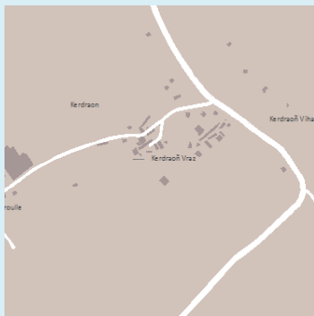
Champ / Legende