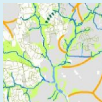
Champ / Legende