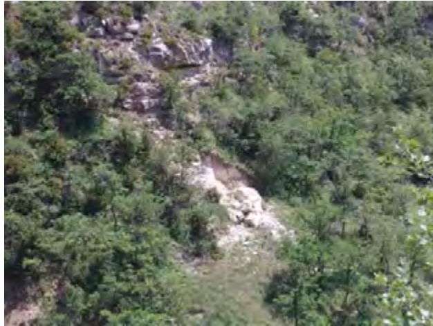
Eboulement de l'escarpement rocheux, en amont du village.

La méthodologie utilisée afin de réaliser la carte d'aléa sur ce cône torrentiel prend en compte plusieurs approches :