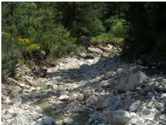
Lave torrentielle dans le ruisseau de la Combe.

La méthodologie utilisée afin de réaliser la carte d'aléa sur ce cône torrentiel prend en compte plusieurs approches :