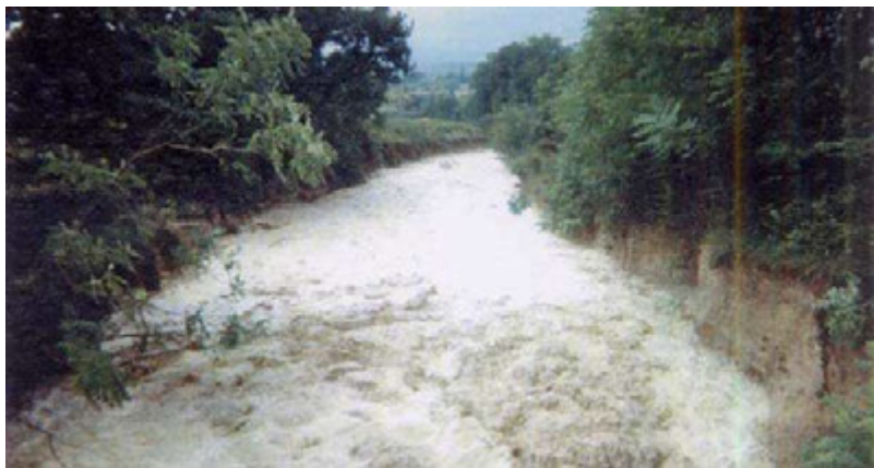
Le Grand Vallat (1993). Commune de Valréas

Ce type de phénomène se retrouve par ailleurs dans les vallats (ou talwegs).