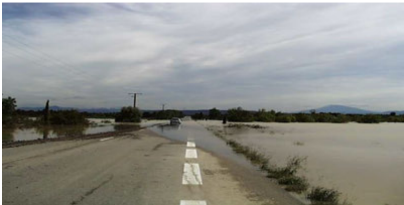
Inondation d'une route près de Rochegude Inondation par débordement d'un cours d'eau (2002).

Le débordement indirect d'un cours d'eau peut se produire: par remontée de l'eau dans les réseaux d'assainissement ou eaux pluviales ; par remontée de nappes alluviales ; par la rupture d'un système d'endiguement ou autres ouvrages de protection.