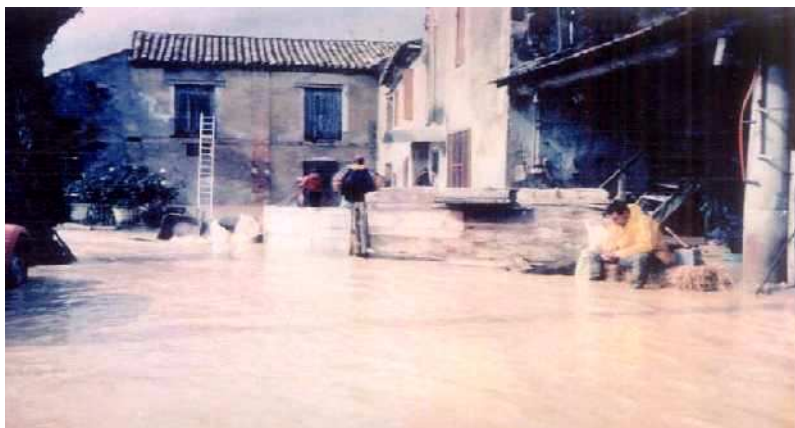
Inondation d'une exploitation agricole sur la commune de Visan.

Ce type d'inondation n'est, en général, pas dangereux pour la vie humaine, mais peut engendrer des dégâts matériels lourds.