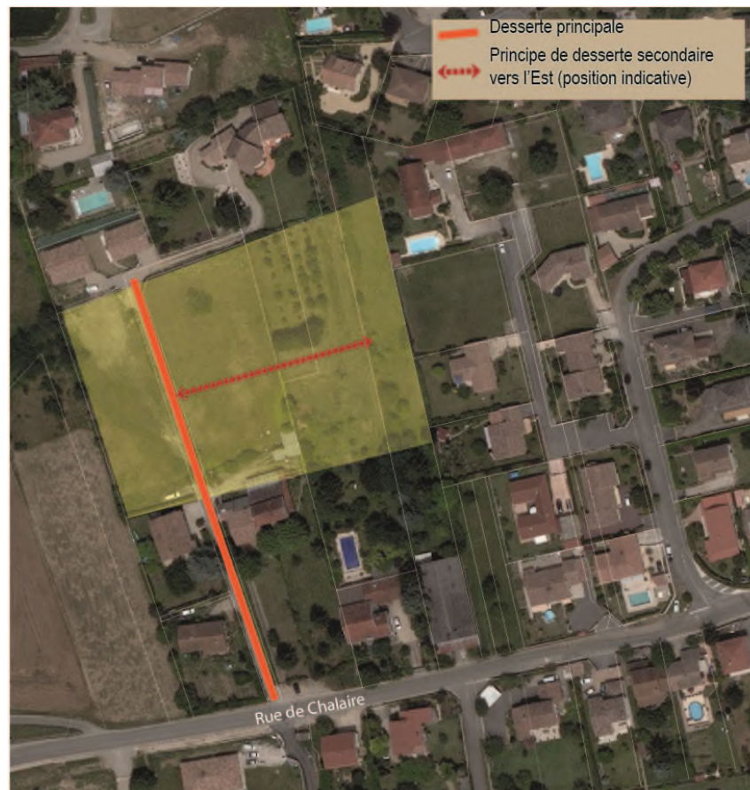
Schéma illustrant le principe de desserte

Une desserte secondaire devra être prévue vers l'Est afin de desservir les parcelles les plus à l'Est.