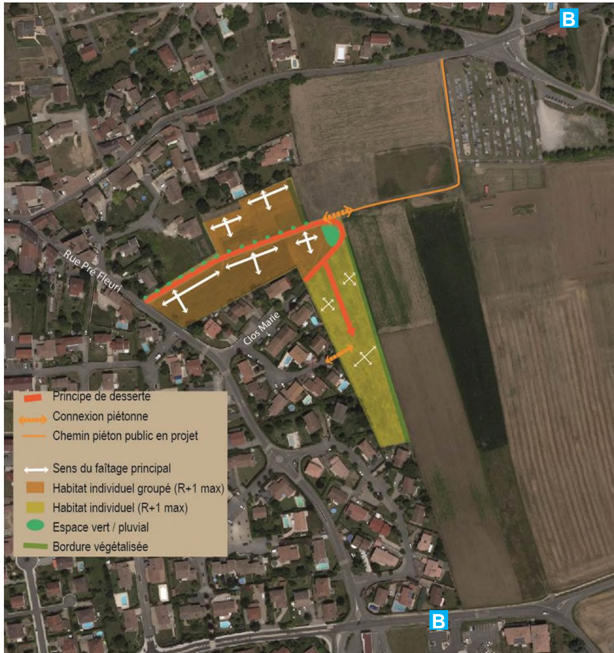
Schéma illustrant les principes d'aménagement