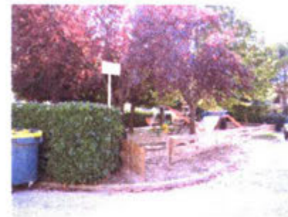
- Maintien de la végétalisation