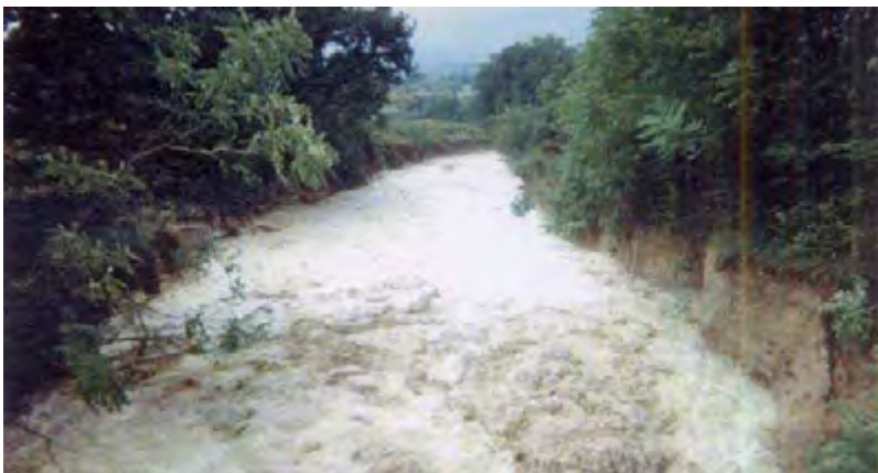
Le Grand Vallat (1993). Commune de Valréas

Ce type de phénomène se retrouve par ailleurs dans les vallats (ou talwegs).