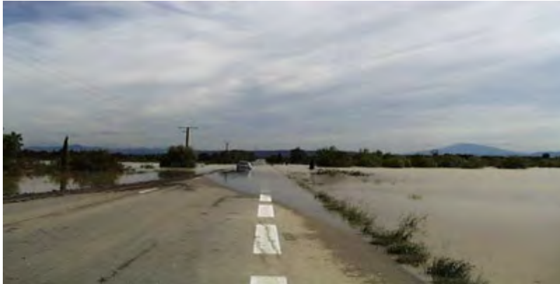
Inondation d'une route près de Rohegude

Le débordement indirect d'un cours d'eau peut se produire: par remontée de l'eau dans les réseaux d'assainissement ou eaux pluviales ; par remontée de nappes alluviales ; par la rupture d'un système d'endiguement ou autres ouvrages de protection.