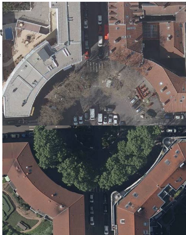
Orthophotographies 2012 et 2015 utilisée à grande échelle (1/500)

Maquettes 3D : en complément des données altimétriques, l'utilisation de l'image permet un rendu réaliste utile dans le suivi de projet (maquettes), ou la concertation.