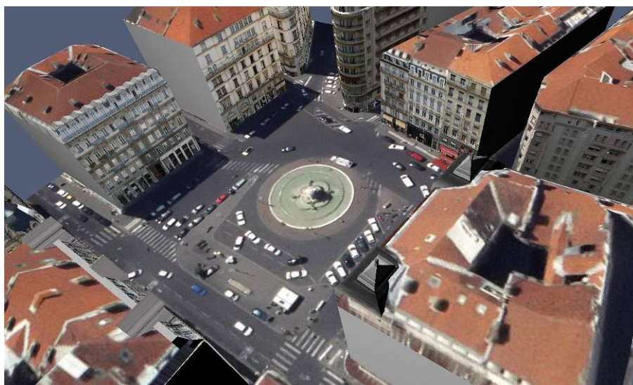
Maquette 3D avec placage de l'ortho au sol et sur les toitures