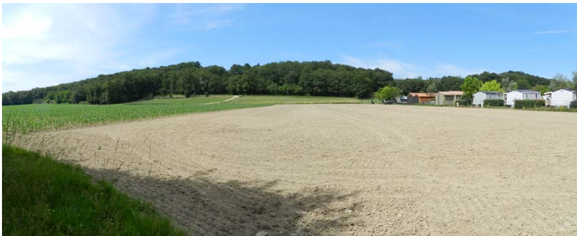
Vue du site d'extension depuis les abords du Bahu