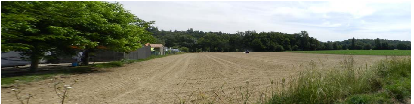
Vue du site d'extension depuis la route du Mouliot